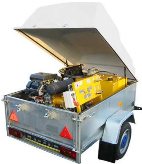
AGREGAT NA PRZYCZEPIE JEDNOOSIOWEJ