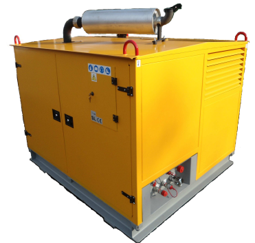
AGREGAT NA RAMIE W OBUDOWIE

W standardowym programie produkcji oferujemy agregaty dwupompowe, umożliwiające zasilanie dwoma niezależnymi strumieniami oleju. Ma to zastosowanie do wiertnic poziomych: większy strumień jest wykorzystywany do napędu głowicy obrotowej, mniejszy – do siłowników posuwu.