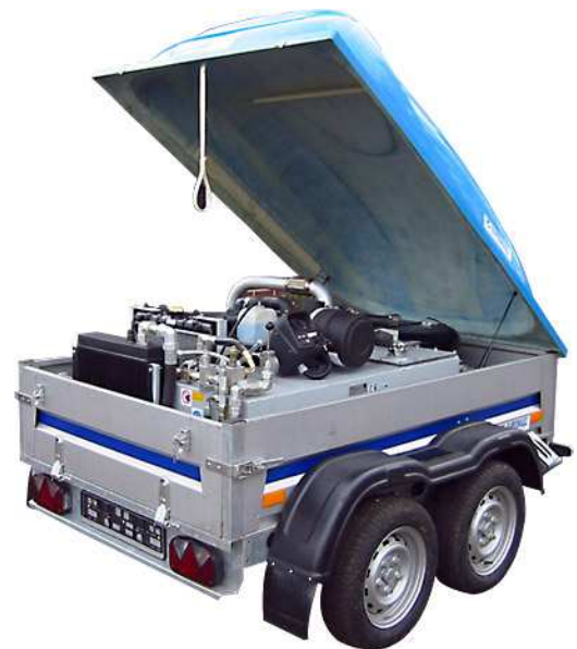
AGREGAT NA PRZYCZEPIE DWUOSIOWEJ